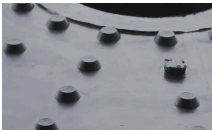
Speciální opěrné body, vymezující vzdálenost mezi podkladem a přírubou komínku.